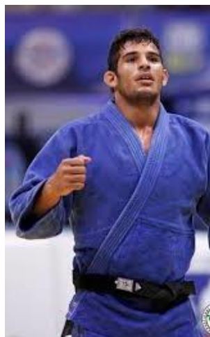
ヴァルラーム・リパルテリアニ