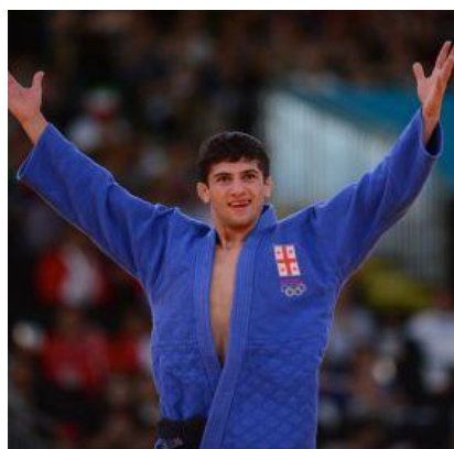
ラシャ・シャフダトウアシビリ